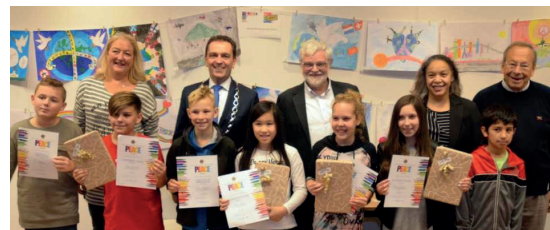
De winnaars van de Vredesposterwedstrijd in Rijswijk.

In zowel de bibliotheek in Voorburg als in Rijswijk hingen de tekeningen van de Vredesposterwedstrijd. Deze wedstrijd wordt jaarlijks georganiseerd door de lokale afdelingen van de Lionsclub. Bezoekers konden in de bibliotheek op hun favoriete tekening stemmen.