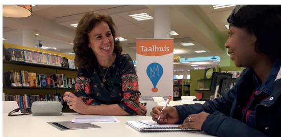
Intakegesprek van een taalvrager voor een Taalmaatje om één keer per week samen te oefenen met spreken, lezen of schrijven.

In 2017 konden bezoekers aansluiten bij een van de Taalhuis leesclubs. Tweemaal in de week kunnen bezoekers zich aanmelden voor een uur lezen met een taalhuisvrijwilliger. Dit doen zij aan de hand van makkelijk geschreven romans of de Startkrant. De Startkrant is de begrijpelijkste krant van Nederland, omdat actuele onderwerpen hier in goed begrijpelijk Nederlands worden beschreven. In totaal hebben 90 mensen 851 keer deelgenomen aan de leesclubs.