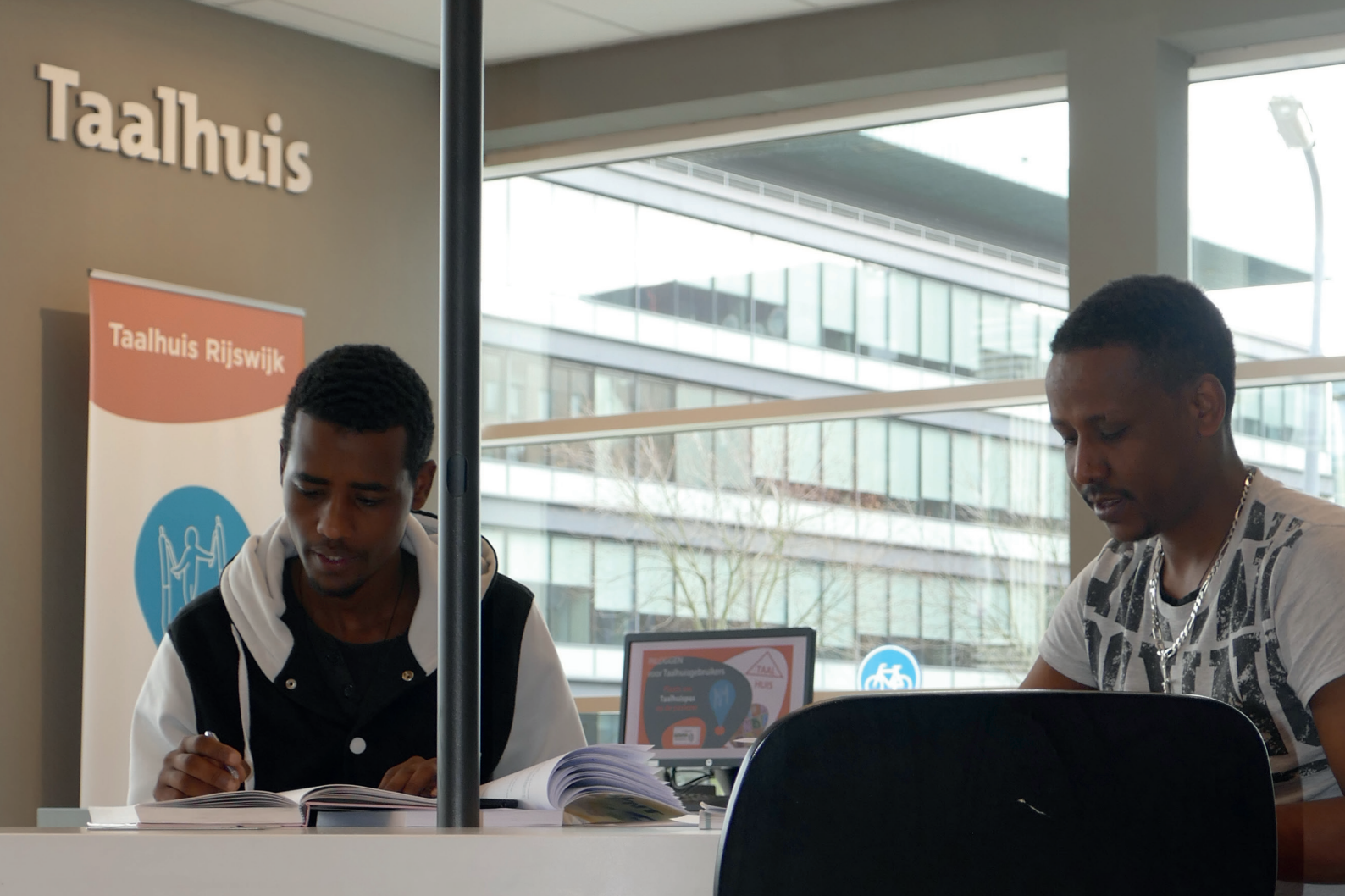
Bezoekers van het Taalhuis Rijswijk.