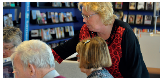
Computercursus in de bibliotheek.

Onze digitale samenleving verandert snel. Om 'digitaal fit' te blijven biedt de bibliotheek samen met SeniorWeb aan de Vliet diverse cursussen. Het aanbod is zowel geschikt voor beginners die nog nooit met een computer, e-reader, tablet of smartphone hebben gewerkt als ook voor gevorderden die specialistische vragen hebben. Naast de cursussen werden ook inloopspreekuren gehouden. In totaal zijn ruim 700 volwassenen digitaal vaardiger geworden.