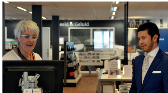
Een medewerker helpt een klant bij de informatiebalie.

In 2017 is het traject met de medewerkers een volgende fase ingegaan. Er zijn loopbaangesprekken georganiseerd om onder andere een helder beeld te hebben van de competenties die binnen de bibliotheek aanwezig zijn. Vakken en klantgerichtheid zijn van belang. Daar komen digitale vaardigheden, een open blik om te kunnen waarnemen wat er in de maatschappij speelt, verbindingen leggen met inwoners en organisaties en het mee kunnen ontwikkelen en uitvoeren van programma's en activiteiten bij. Belangrijk uitgangspunt is dat medewerkers mee ontwikkelen met de bibliotheek. Daar is tijd en het opbouwen van ervaring voor nodig.