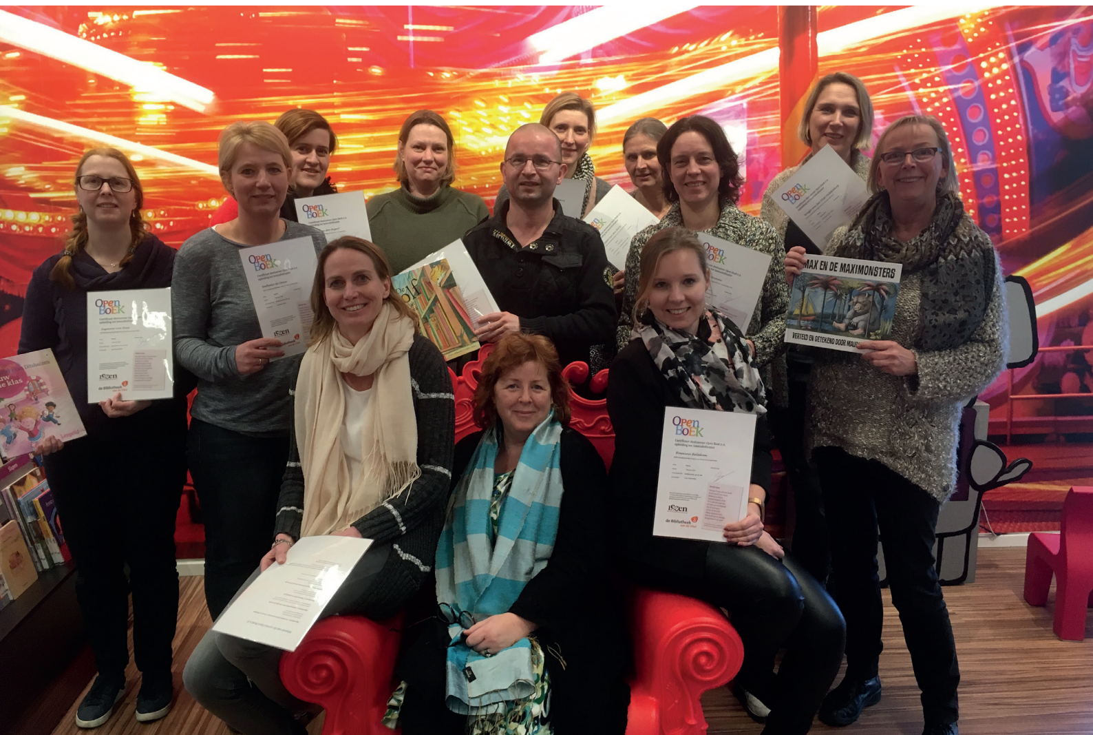
Leerkrachten in het basisonderwijs worden door de bibliotheek opgeleid tot leescoördinator.