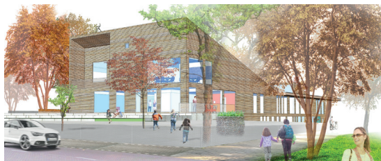
Sfeerimpressie van het Kulturhus Stompwijk.

Eind 2017 is de bouw van het nieuwe Kulturhus in Stompwijk gestart. Het Kulturhus biedt vanaf oktober 2018 onderdak aan de Maerten van den Veldeschool, het Dorpshuis Stompwijk met al zijn gebruikers, Kinderopvang Zoeterwoude, Jeugdgezondheidszorg Zuid-Holland West en de bibliotheek. Het nieuwe Kulturhus zal niet alleen een markant punt in het centrum van Stompwijk zijn, maar ook een “huiskamer” voor de hele Stompwijkse gemeenschap, van jong tot oud.