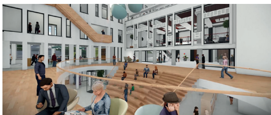
Impressie van het atrium in het Huis van de Stad Rijswijk.

Lezen is noodzakelijk om mee te kunnen doen in de samenleving. Lezen helpt ons om te participeren in de maatschappij, zelfredzaam te zijn, ons te ontwikkelen en sociaal te functioneren. Door te lezen, kunnen we ons beter inleven, meer begrip opbrengen voor anderen en gemakkelijker nieuwe contacten leggen. Wie in zijn vrije tijd voor het plezier leest, ziet zijn woordenschat en taalvaardigheid groeien en gaat vaak daardoor weer meer lezen. Met lezen gaat de wereld voor je open.