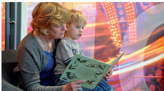
Een kind wordt voorgelezen in de bibliotheek.