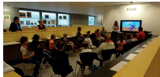
Workshop 'bibberbots bouwen' in het E-Lab in Rijswijk.

De Week van de Mediawijsheid werd gecombineerd met het Mondriaanjaar, waardoor er creatieve mediawijze workshops gevolgd konden worden. De oudere kinderen konden zich creatief uiten in het Atelier van de Kunstuitleen Rijswijk. Ze gingen aan de slag met de kunstwerken van Mondriaan. Verder werden in het E-Lab in Rijswijk en in de bibliotheek in Leidschendam en Voorburg workshops Bibberbots maken gegeven en leerden kinderen creatief programmeren.